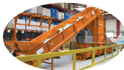
ОПЦИЯ: ЛЕНТОЧНЫЙ КОНВЕЙЕР